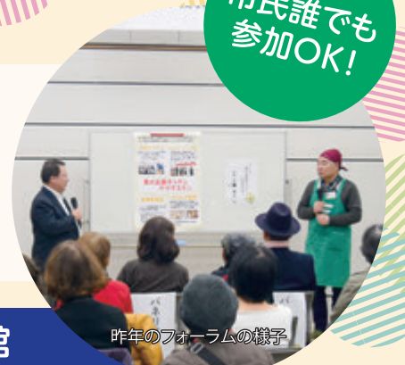
昨年のフォーラムの様子

みなさんが住んでいる合志市には、趣味や体操など、地域の仲間たちと一緒にさまざまな活動に取り組んでいる団体がたくさんあります。今回の地域げんきフォーラムでは、地域で活動されている団体に日頃の活動を紹介していただきます。みなさんが行ってみたい活動が見つかるかも!?