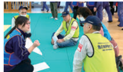
災害ボランティアセンター設置訓練 いざというときに支え合い安心して過ごせるよう、市民のみなさんと毎年取り組んでいます。