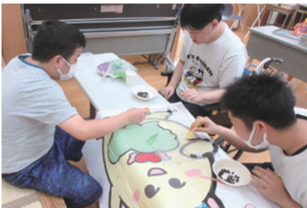
楽しみながら作りました

【開催日】令和7年2月27日(木) ～3月12日(水) 【場所】お菓子の香梅・光の森店