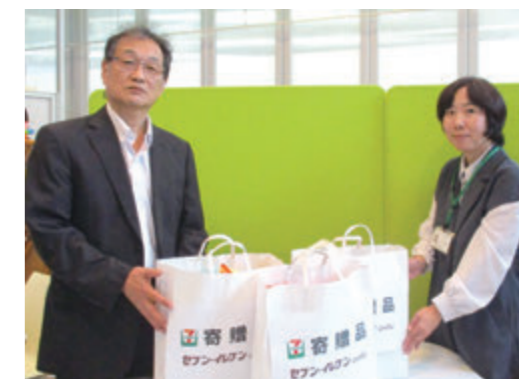
暮らしに寄り添う寄贈をありがとうございました

セブン・イレブン・ジャパン熊本地区事務所の有志の方より、麺や菓子などの食料品や、ノートなどの日用品を寄贈して頂きました。今回頂きました食料品などは、さまざまな事情により経済的に困りの方々へお届けさせていただきました。貴重な品物をご寄贈いただき、心よりお礼申し上げます。